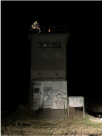
Grenzturm des Grenzdenkmals am Hessendamm