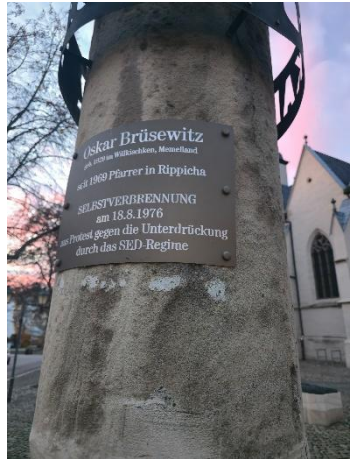
Gedenksäule für Oskar Brüsewitz in Zeitz.

Im Jahr 2026 jährt sich die Selbstverbrennung des evangelischen Pfarrers Oskar Brüsewitz zum 50. Mal. Am 18. August 1976 zündete Brüsewitz sich vor der Michaeliskirche in Zeitz selbst an. Mit einem Transparent hatte er zuvor gegen die Bildungs- und Kirchenpolitik der SED protestiert. Vier Tage später erlag er seinen schweren Verletzungen. Bis heute gehen die Meinungen darüber auseinander, wie die Selbstverbrennung zu bewerten sei. In der Gedenkwoche zwischen Selbstverbrennungsversuch und Todestag sind Gedenkveranstaltungen in Planung.