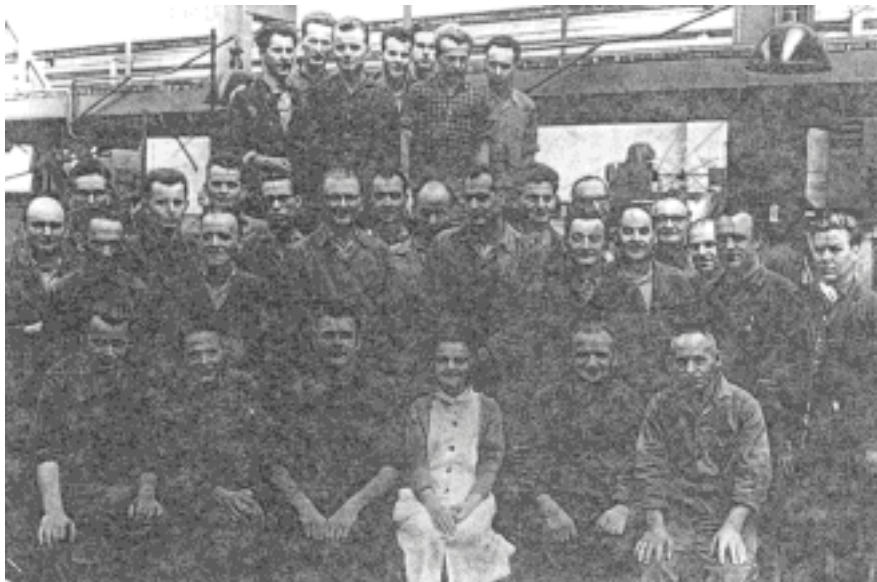
Brigade im Dimitroffwerk mit GM „Pantoffel“ (Anfang der 80er Jahre)