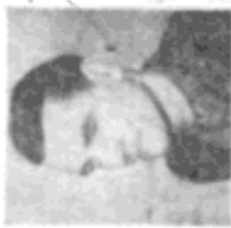
Das ist der Arbeiter aus der Fabrik... (Caption describing the person in the portrait.)

Unter dem Vorwand der „Klassenkampf“- und „Klassen- und Klassenkampf“-Kampagne in der Sowjetunion werden in der Sowjetunion die Arbeiter und Arbeiterinnen in der Sowjetunion... (Text continues with a detailed account of the events of June 17, 1953, at the Bitterfeld Electrochemical Plant, including mentions of provocateurs and the actions of the workers' committee.)