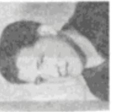
Das ist der Arbeiter aus der Fabrik... (Caption describing the person in the portrait.)

Unternehmen wir die Methoden, mit denen die Feinde der Arbeiterklasse unseren Staat stürzen wollten... (Introduction to the second article, discussing the methods used by enemies of the workers' state.)