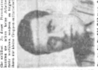
Das ist der Arbeiter aus der Fabrik... (Caption describing the person in the portrait.)

Unternehmen wir die Methoden, mit denen die Feinde der Arbeiterklasse unseren Staat stürzen wollten... (Continuation of the article text, discussing the methods used by enemies of the workers' state.)