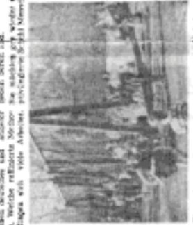
Das ist der Arbeiter aus der Fabrik... (Caption describing the person in the portrait.)

Die Arbeiter und Arbeiterinnen... (Continuation of the article text, discussing the role of the workers' committee and the actions taken on June 17, 1953.)