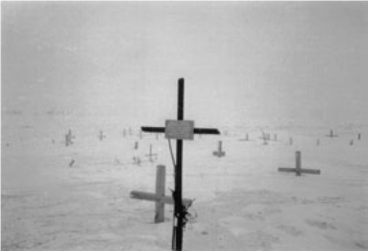
Gräberfeld in Workuta (Horst Schüler, 1992)

Herausgeber: Regierungspräsidium Magdeburg Gedenkstätte „Roter Ochse“ Halle (Saale) Hausanschrift: Am Kirchtor 20, 06108 Halle, Tel.: 03 45 - 2 20 12 13 od. 2 20 12 76