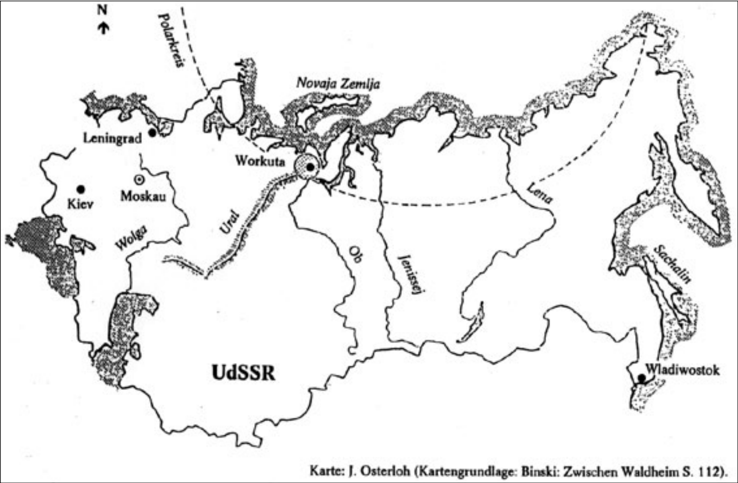
Karte vom Lagerkomplex Workuta

Workuta: Wir sind von dort aus [dem Gefängnis in Halle] nach Berlin Lichtenberg gekommen. Wir wurden nur noch kurz vor dem Transport einer russischen Gesundheitsinspektorin vorgeführt. Das war alles. Dann wurden wir Ende November ... auf einer LKW-Plattform festgekettet, aber über Kreuz. Vor uns dann waren zwei Posten mit Maschinenpistole, mit einem Hund. Wir wurden direkt über die Autobahn nach Berlin-Lichtenberg transportiert, in das dortige Zuchthaus. Nach einer Woche ging es weiter in einem sowjetischen Eisenbahn-Gefangenenwagen, der äußerlich als Postwagen gekennzeichnet war ... Richtung Frankfurt/Oder–Brest-Litovsk, wo wir ausgeladen worden sind, dann weiter nach Moskau, wo wir wiederum ausgeladen worden sind. Wir waren etwa 14 Tage in der Lubjanka und trafen dann in Workuta ein ..., wo die Gefangenen in verschiedenen Schächten verteilt worden sind. Ich war im Januar 1951 Lager Nr. 10, Schacht 29 zugeteilt.