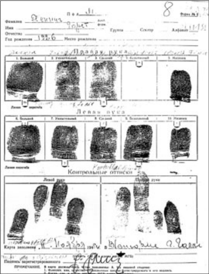
Faksimile der Fingerabdrücke